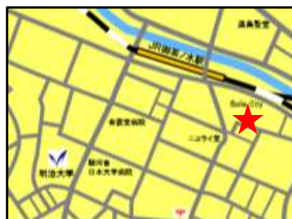
ニコライ堂の東側・幽霊坂の南側