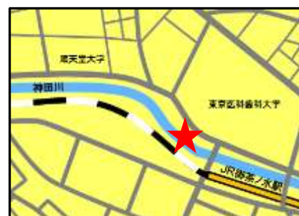
お茶の水橋から見た神田川(御茶ノ水駅西側)