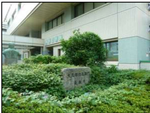
杏雲堂病院 植え込み