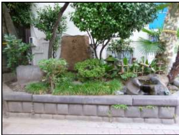
JR御茶ノ水駅西口前 交番脇

お茶の水橋が架かる神田川北岸は、いまも切り立った崖となっている。かつては中国の名勝 赤壁 せきへき にちなんで「小赤壁 しょうせきへき 」とよばれた。その風光明媚な景観は、江戸名所の一つとして江戸から明治の人びとに愛され、「茗溪 めいげい 」とも呼ばれた。「茗」には、「お茶」の意味がある。ちなみに JR 御茶ノ水駅前のお茶の水橋口から 聖橋口 ひじりばし までを結ぶ駅南の街路は、「茗溪通り」と呼ばれている。