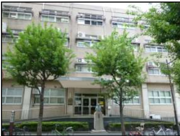
日本大学歯学部総合歯学研究所1号館

同31年（1898）男爵となり、大正7年（1918）東京大森の別邸で死去。墓は、台東区の谷中墓地にある。