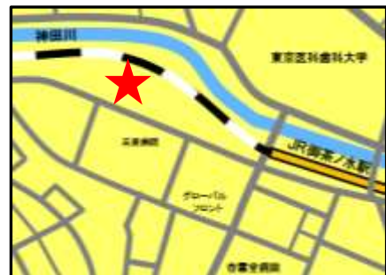
東京医科歯科大学 難治疾患研究所 (かえで通り。御茶ノ水駅前交番を西入る)