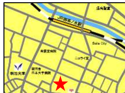
三井住友海上駿河台ビル