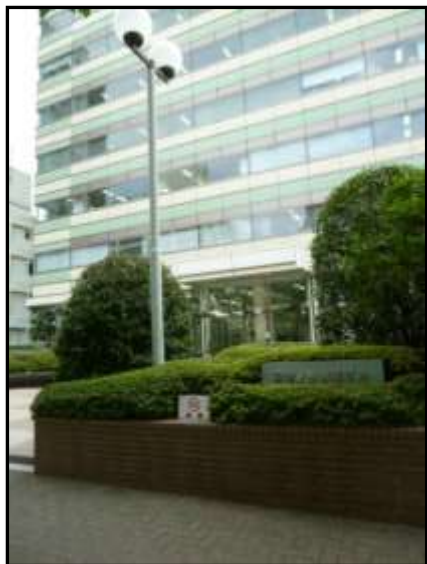
御茶ノ水杏雲ビル