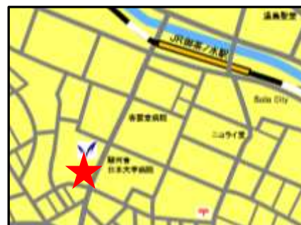
明治大学リバティタワー