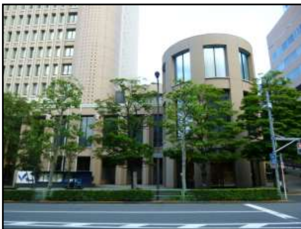
明治大学リバティタワー 北ウイング

ちなみに社名「三省堂」のいわれは、『論語』学而篇にある「吾日三省吾身」（われ、日にわが身を三省す）に由来し、「日に幾度となくわが身を省みる」ことを意味している。