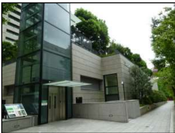
三井住友海上駿河台ビル付近

京都大徳寺の孤篷庵の茶室は、遠州の作として有名である。遠州の上屋敷は、いまの三井住友海上ビルあたりにあった。