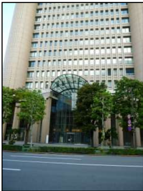
明治大学リバティタワー

ちなみに中坊家の屋敷図は、石川武美記念図書館(旧お茶の水図書館)の成賞堂文庫(歴史家徳富蘇峰旧蔵)で保管されている。また屋敷図のカラーパネルが、アカデミーコモン地下 1 階の博物館ホールに展示されている。