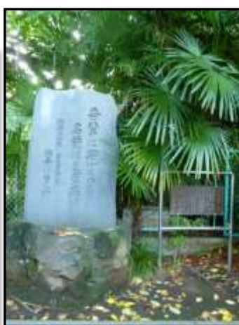
千代田区立お茶の水小学校 「吾輩は猫である」石碑