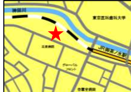
日新火災海上保険株式会社