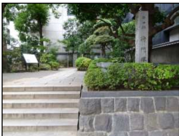
首塚(都旧跡 将門塚) 記事は 1 平将門 参照