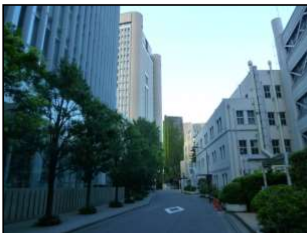
明治大学アカデミーコモン(左側)

なお鳩巢は、現在、中央区銀座にある書画用品・香の老舗「鳩居堂」の命名者であるという。鳩居堂は、もと京都寺町の本能寺門前にある薬種商だった。屋号は、中国の『詩経』召南篇にある「維鵲有巢、維鳩居之」（維れ かさぎ 鵲に巢有り、維れ はと 鳩之に居る）に由来する。巢作りのうまい鵲の巢に、巢作りの下手な鳩が入って棲みつく（いわゆる託卵の習性）を、女性が夫に嫁いで婚家を我が家とすること、または仮の住まいで暮らすことにたとえる。鳩居堂は、カササギの巢に託卵する鳩に「店は顧客のもの」という謙譲の意を込めたと解されている。