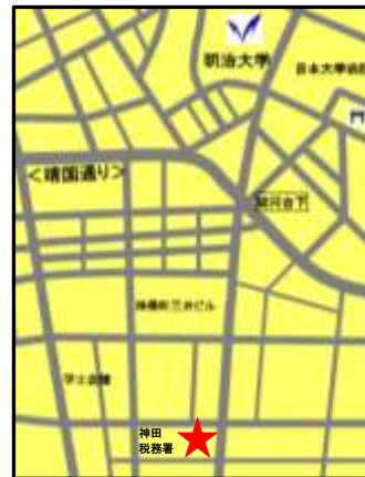
奥の神田税務署の東側(手前側)付近