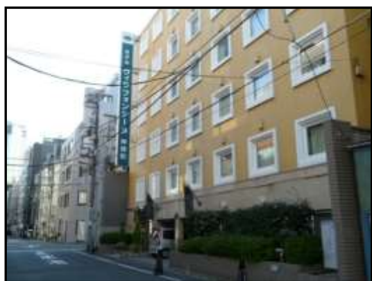
ホテル ヴィラフォンテーヌ神保町 (旧錦華小学校跡地)

大正 5 年（1916）12 月 9 日胃潰瘍で死去、享年 50。生前多くの弟子を育成し、大正 6 年（1917）12 月から初版『漱石全集』全 13 巻が刊行された（8 年 6 月完結）。森鷗外とともに近代文学の巨匠とたたえられている。なお、お茶の水小学校の敷地に「吾輩は猫である 名前はまだ無い」と刻まれた石碑が建てられている。